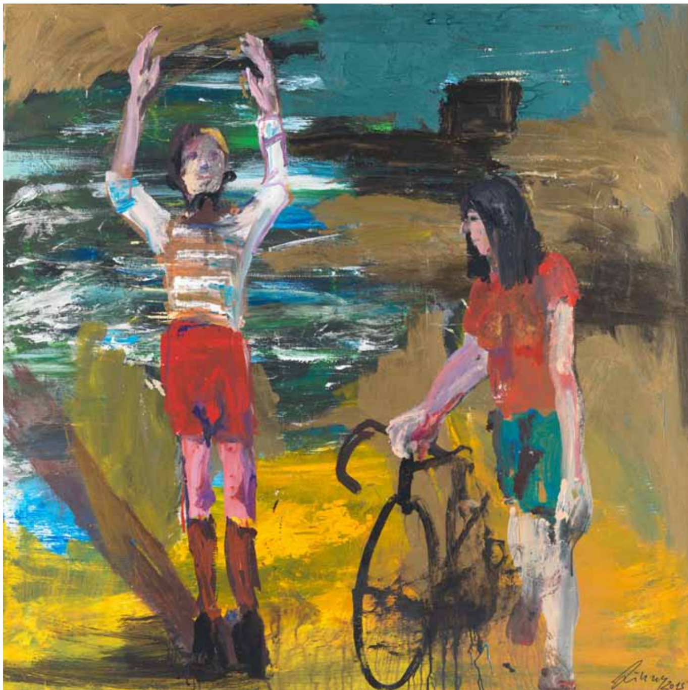
Religiöser Wahnsinn an Christi Himmelfahrt 2015 Acryl auf Leinwand 120 x 120 cm