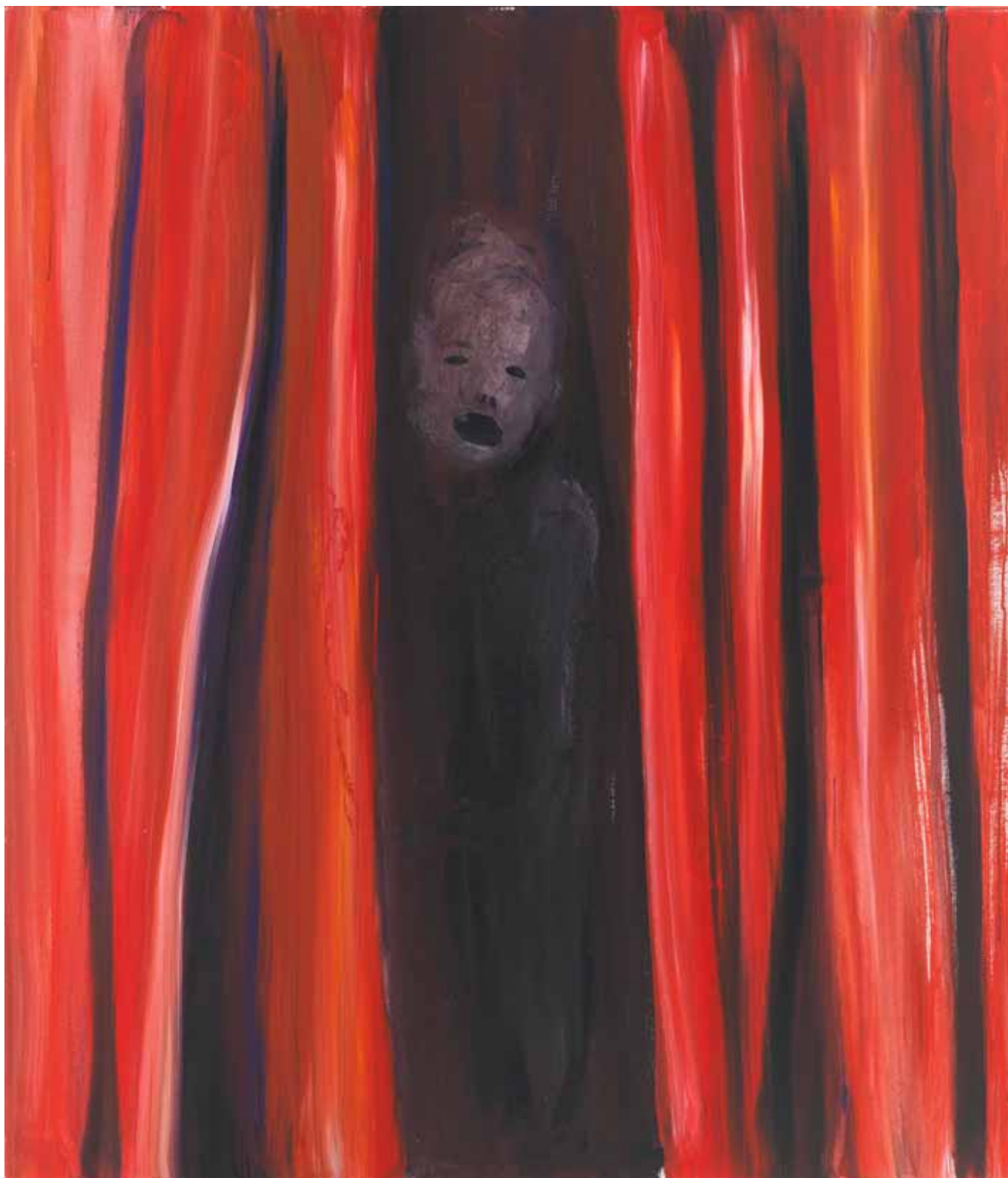
Das Elend 2015 Acryl auf Leinwand 140 x 120 cm