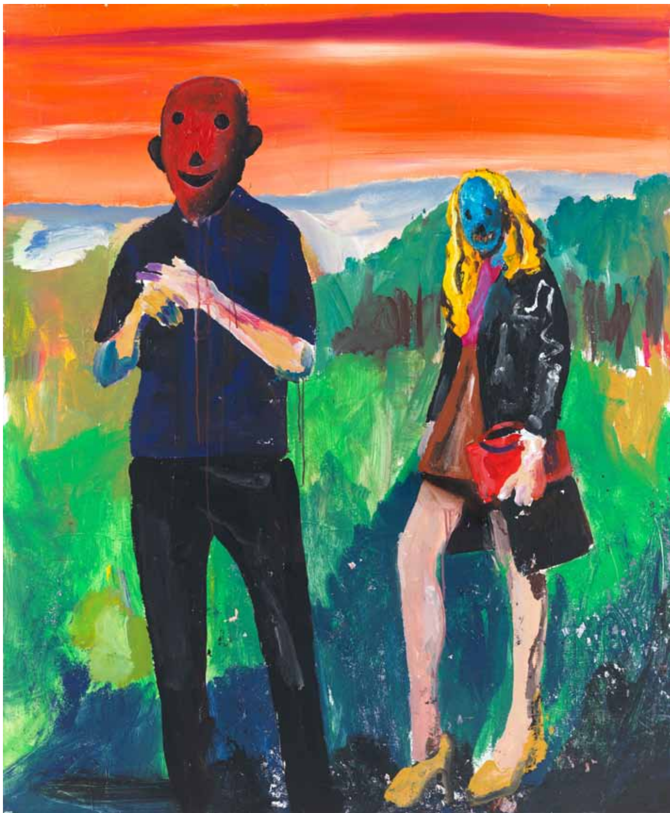
Zombiesshooting 2015 Acryl auf Leinwand 145 x 120 cm