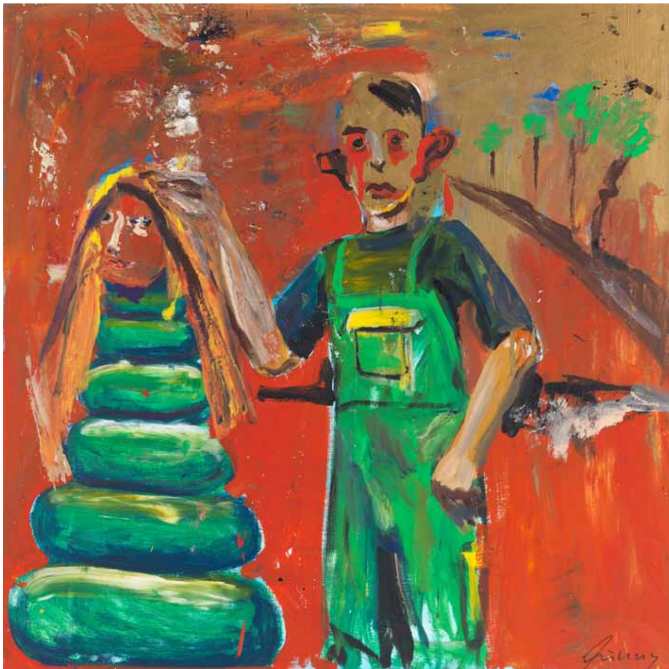
Der Gärtner 2015 Acryl auf Leinwand 120 x 120 cm