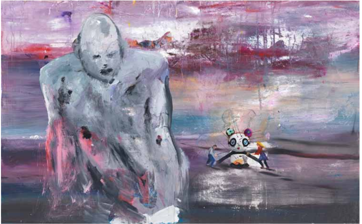
Voodoo am Kriegerdenkmal 2015 Acryl auf Leinwand 100 x 160 cm