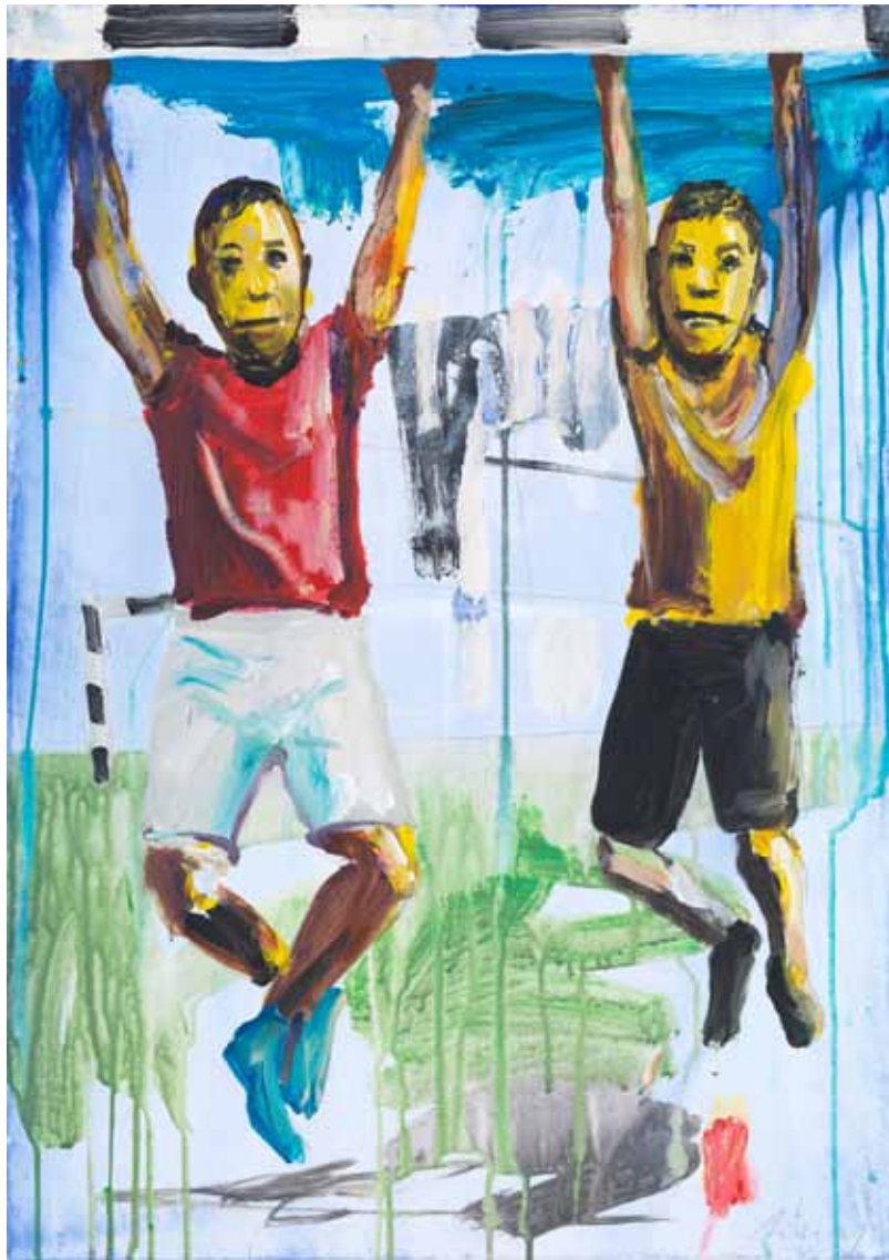
Rumhängen 2015 Acryl auf Leinwand 70 x 50 cm