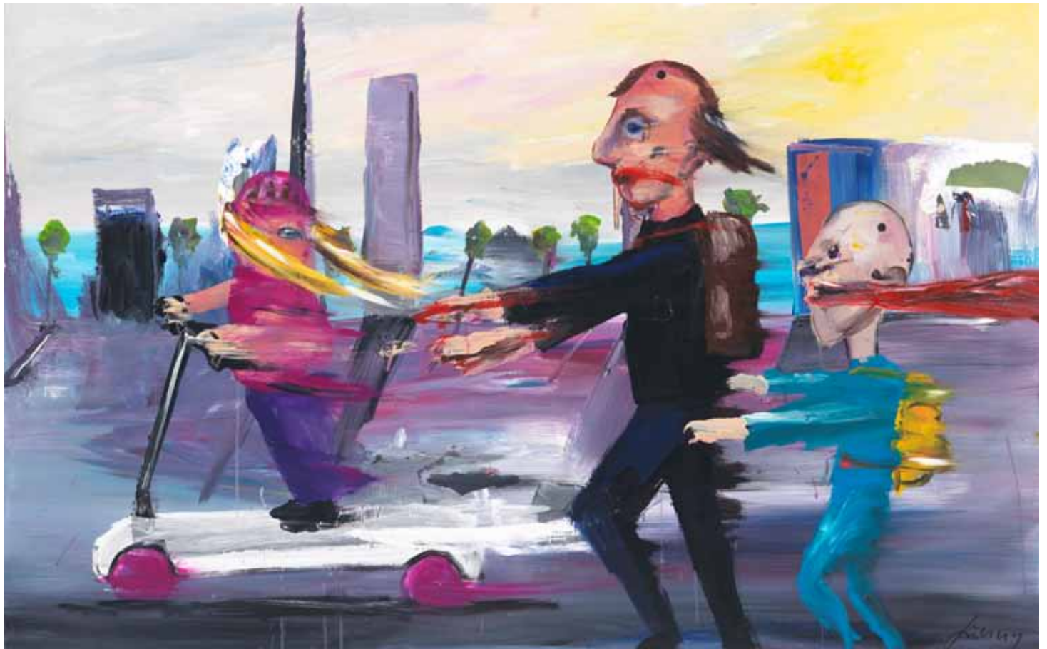
Die wilde Jagd 2015 Acryl auf Leinwand 100 x 160 cm