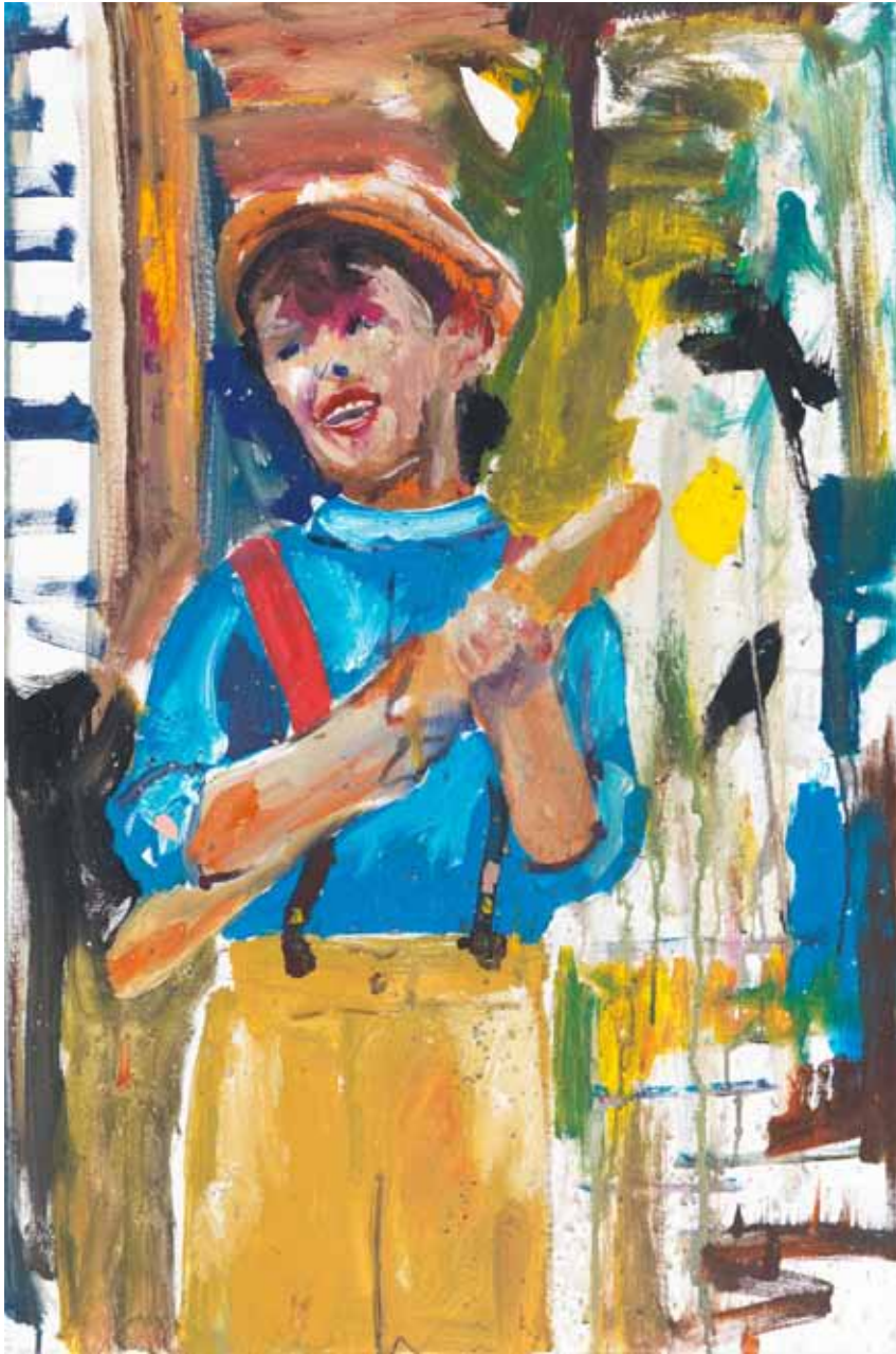
Der Junge mit dem Brot 2015 Acryl auf Leinwand 90 x 60 cm