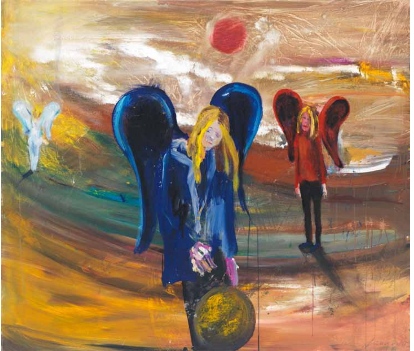
Ballspielende Engel 2015 Acryl auf Leinwand 120 x 140 cm