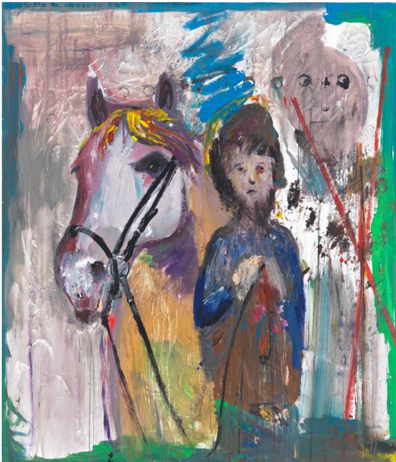
Ein Heiliger der Traurigkeit 2015 Acryl auf Leinwand 140 x 120 cm