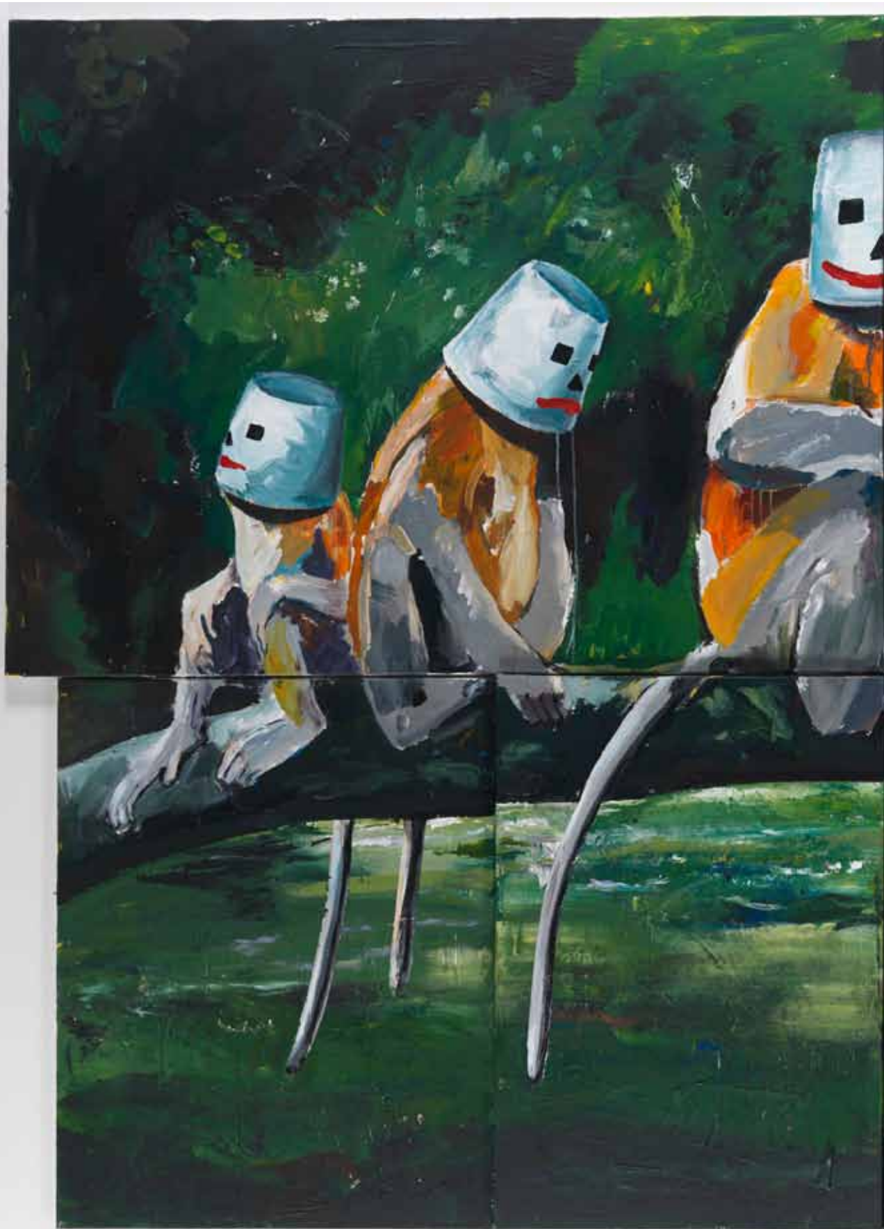
Die Affen 2015 Acryl auf Leinwand 240 x 320 cm