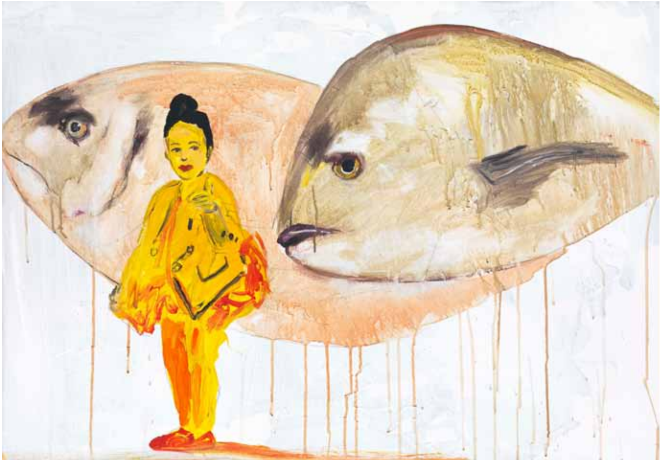
Das Mädchen und die Fische 2015 Acryl auf Leinwand 70 x 100 cm