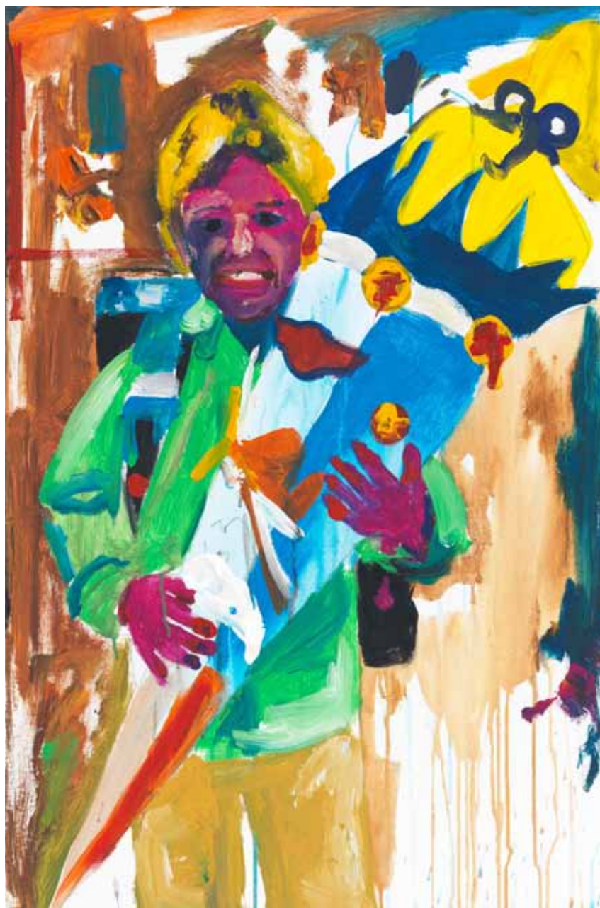
Die Einschulung 2015 Acryl auf Leinwand 90 x 60 cm