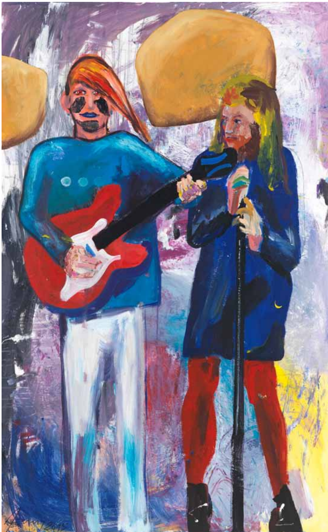
Die Bluebirds 2015 Acryl auf Leinwand 160 x 100 cm