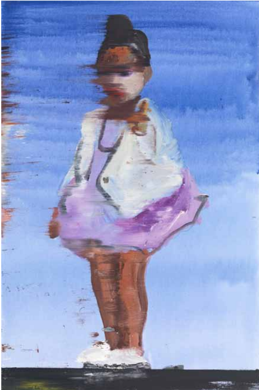
Püppi 2015 Acryl auf Leinwand 90 x 60 cm